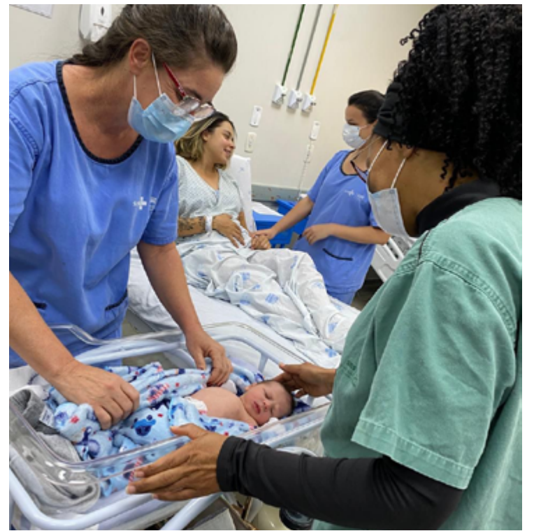
A instalação do PAV em Alexânia faz parte de um esforço contínuo da Receita Federal para expandir e melhorar o acesso aos seus serviços

O hospital beneficia mais de 1 milhão de moradores do município e de cidades próximas, integrando a rede de saúde no Entorno do Distrito