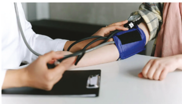
A hipertensão arterial, ou pressão alta, atinge 35% da população; em muitos casos as pessoas só descobrem quando algo mais grave acontece