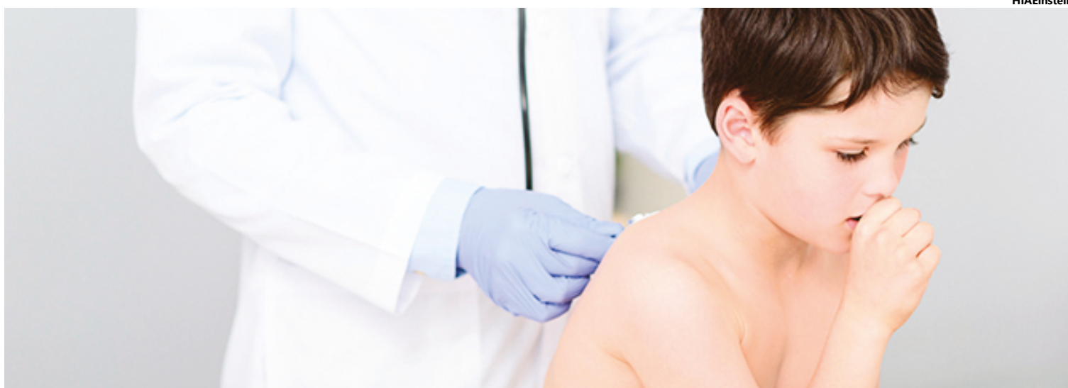
Secretaria Estadual da Saúde emite alerta sobre a bronquiolite e, ao mesmo tempo, faz trabalho de conscientização da população sobre diagnóstico e prevenção

Segundo a infectologista pediátrica do Hospital Estadual de Doenças Tropicais Dr. Anuar Auad (HDT), uma das unidades que administram tratamento da enfermidade em Goiás, Lu-