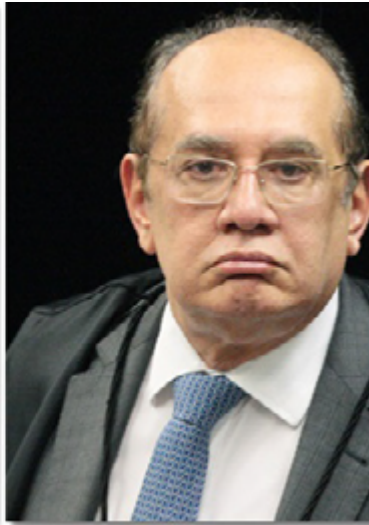
Jorge Kajuru e Gilmar Mendes: conciliação