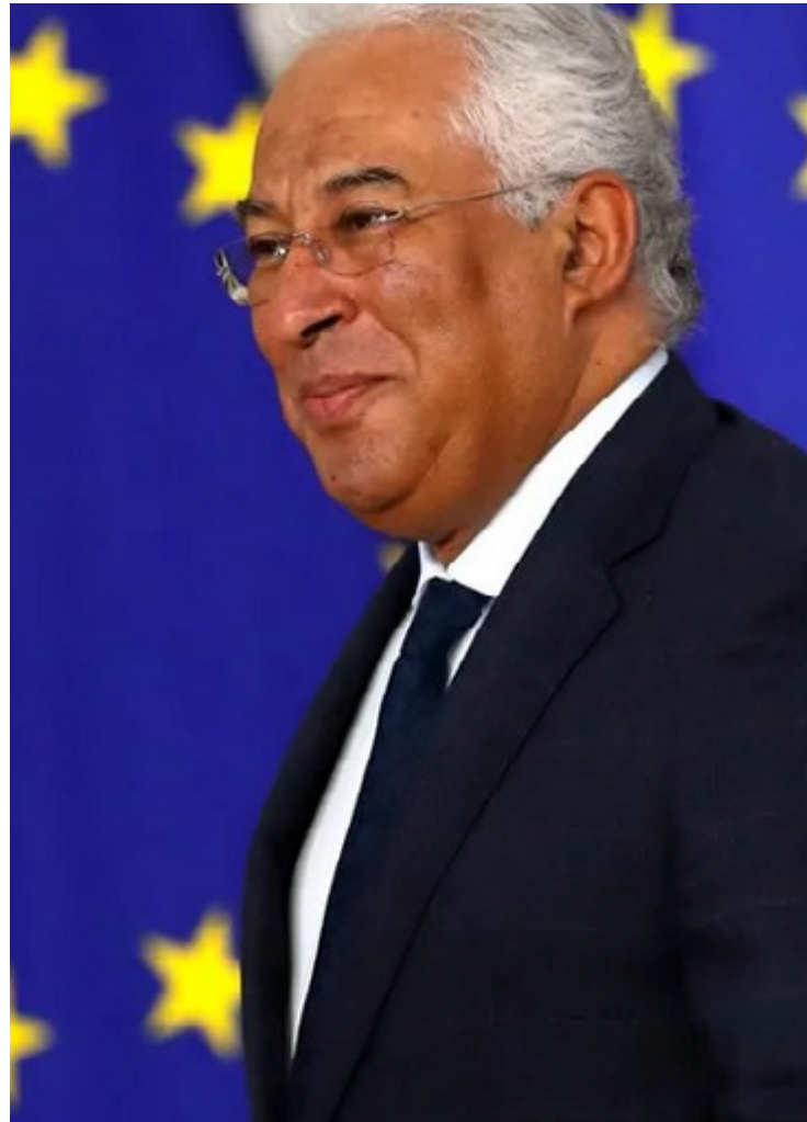
Tensão: António Costa causa mal-estar no Velho Mundo após declarações controversas

Nos últimos anos, houve um renovado interesse pelo patrimônio e identidade judaica na Europa, exemplificado por iniciativas como a lei de cidadania sefardita de Portugal. No entanto, esses desenvolvimentos positivos são frequentemente ofuscados por incidentes antissemitas persistentes e tensões políticas.