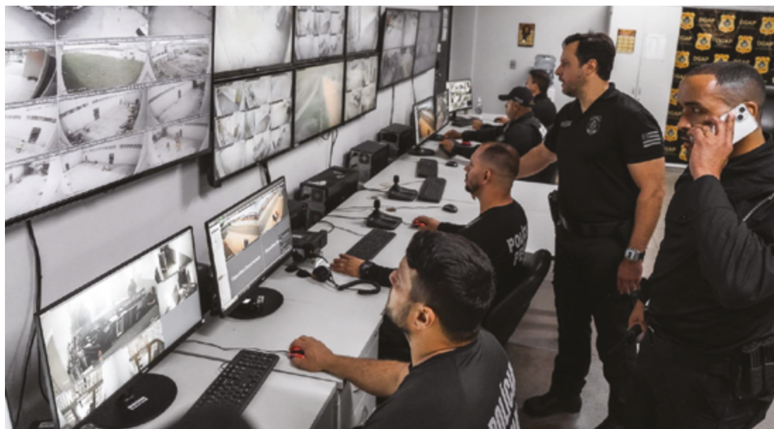
Queda dos índices de feminicídio, avalia o governo, é resultado do trabalho de integração das forças policiais

A Polícia Militar de Goiás (PMGO) realizou no primeiro semestre deste ano, 97.804 acompanhamento de medidas protetivas, isso significa um aumento de mais de 338%, em relação ao mesmo período no anterior, que registrou 28.707. No primeiro semestre de 2024, a Polícia Civil de Goiás enviou ao Poder Judiciário 8.013 inquéritos policiais com autoria definida. Esses dados são de inquéritos que apuraram crimes envolvendo violência doméstica e familiar contra a mulher.