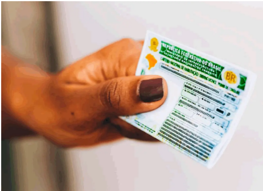
Candidato que estiver com dúvida em relação ao andamento ou validade do processo pode consultar no Portal Expresso ou site do Detran

Mais de 49 mil processos foram paralisados logo após a abertura do Renach – pagamento da taxa inicial. Outros 9,2 mil candidatos fizeram somente o exame médico.