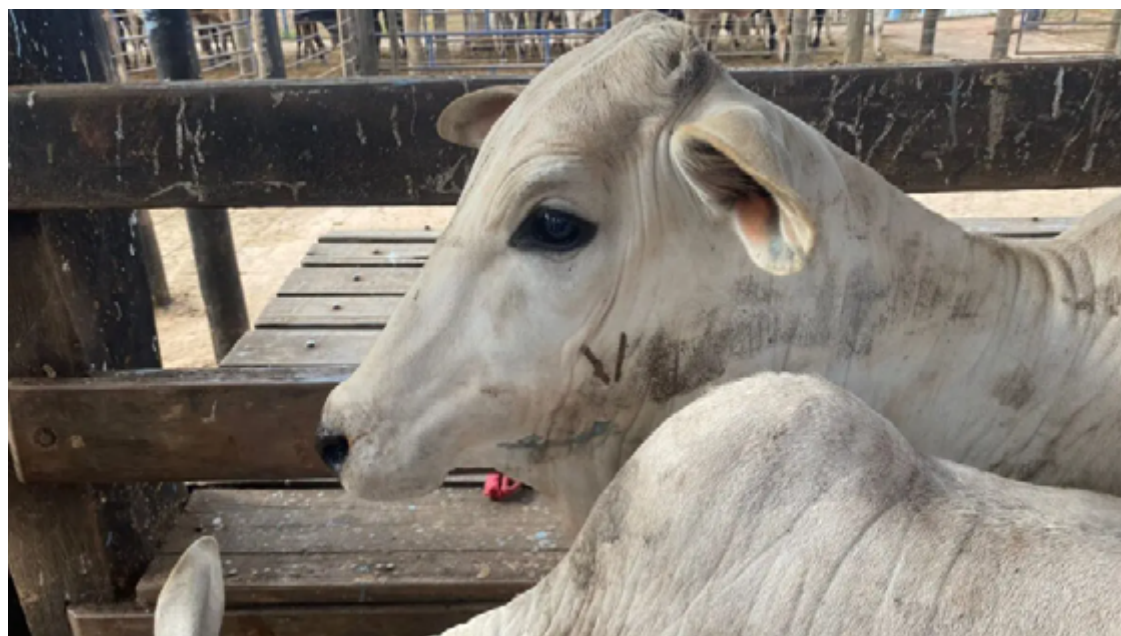
Apesar da queda nos casos, é preciso prevenir-se, combatendo o mosquito Aedes Aegypti

As informações foram publicadas nesta segunda-feira (08/07), no Diário Oficial do Estado, por meio da Portaria nº 326.