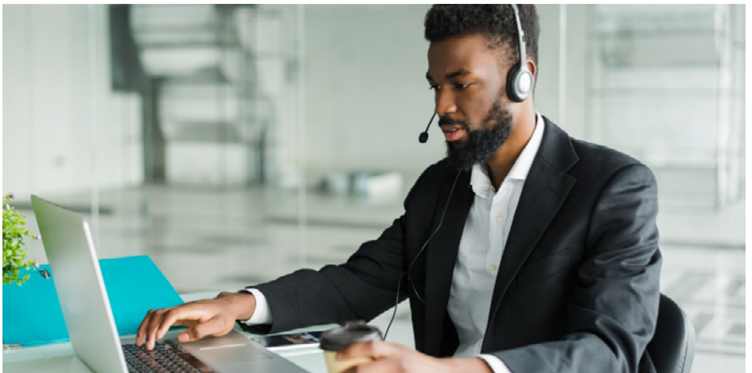
Apesar da interrupção do atendimento presencial, os serviços continuarão sendo oferecidos por meio de contatos eletrônicos

As obras de manutenção no Fórum são necessárias para garantir a segurança e o bom fun-